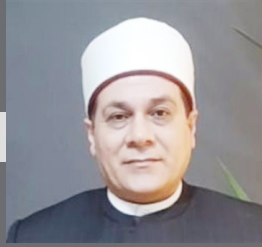
الشيخ مظهر شاهين