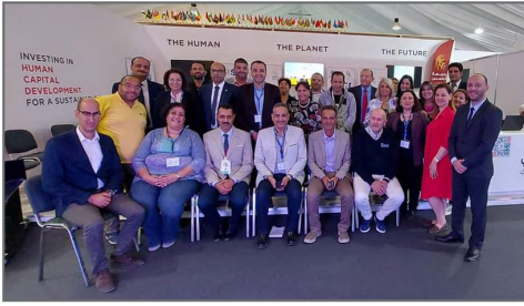
مؤتمر الـ cop ومشاركة عدد من الوزراء والمحافظين لجناح وفعاليات الهيئة

الموجهة للفئات الأكثر هشاشة من أجل تخفيف الأعباء الاقتصادية على المواطنين، ولا سيما الناتجة عن الأزمات العالمية في الفترة الحالية، وذلك من خلال تعبئة الموارد المجتمعية، والشراكة مع العديد من المؤسسات مثل بنك الكساء المصري و Hands along the Nile والمشاركة في مبادرة كنف بكتف تحت مظلة التحالف الوطني للعمل الأهلي والتنموي.