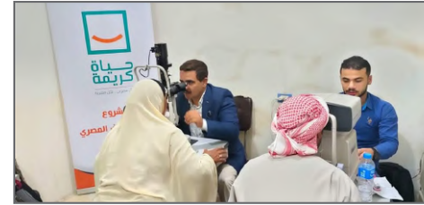
مبادرة حياة كريمة