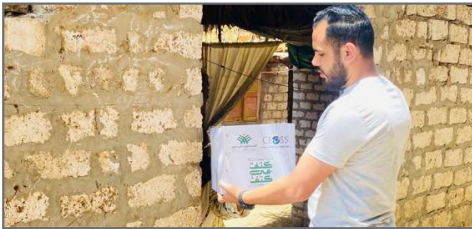
مبادرة كنف بكتف / الإغاثة