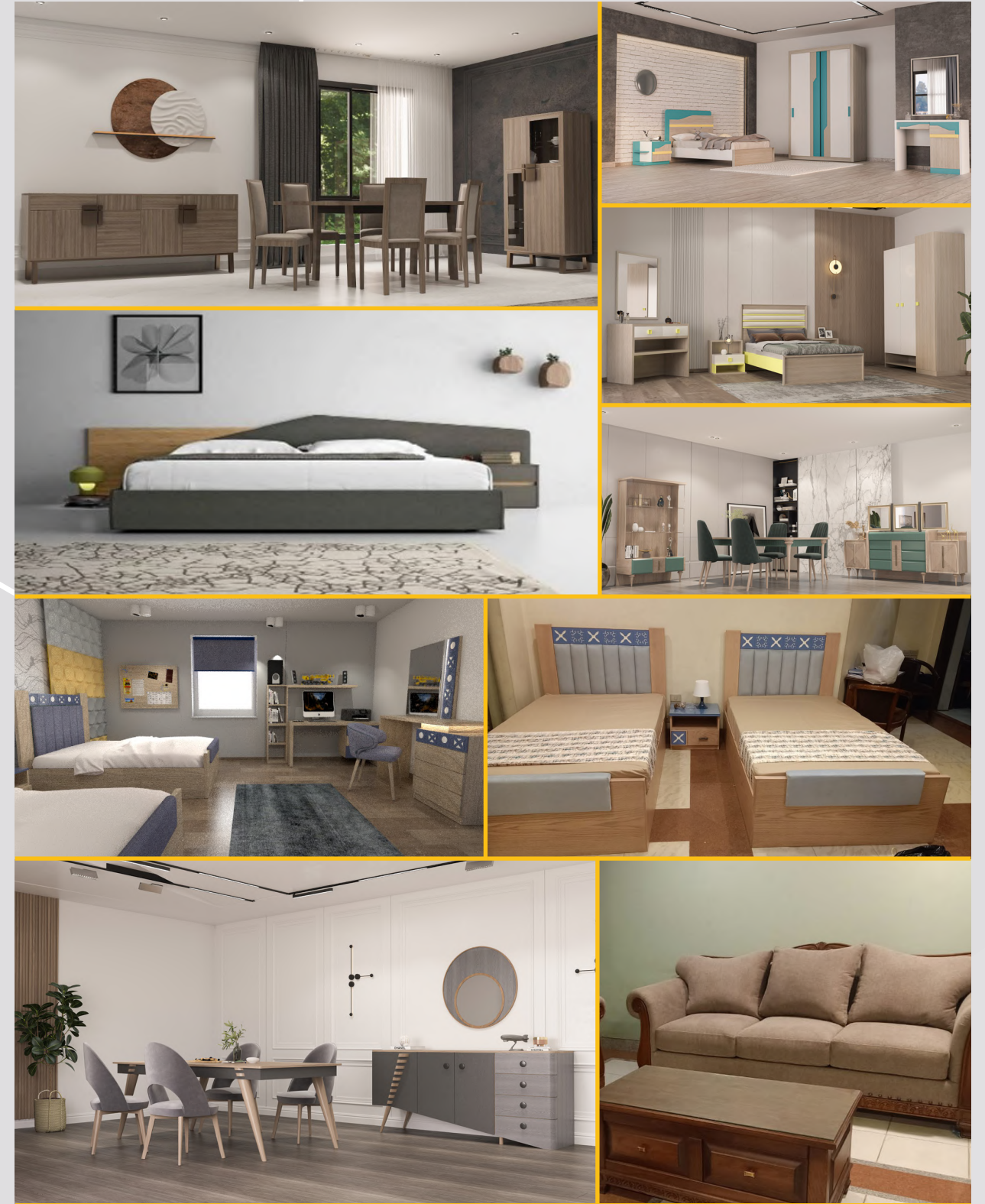
منتجات إيطساوود 2023