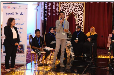
الاحتفال بيوم القضاء على الفقر/ الكرامة للجميع

- في سياق آخر استمرت وحدة التنمية المحلية في تبني العديد من القضايا التنموية الأخرى، ولا سيما قضية التغيرات المناخية. وفي هذا السياق شاركت الوحدة في قمة الأمم المتحدة للمناخ COP27، والتي استضافتها مصر بمدينة شرم الشيخ، وهو الحدث الأهم والأكبر الذي يستهدف اعتراف الدول الكبرى بمسؤولياتها إزاء التغيرات المناخية. وخلال المؤتمر أقامت وحدة التنمية المحلية العديد من الفعاليات الهامة شملت: تنظيم (4) ندوات حول تحديات ومطالبات الأشخاص ذوي الإعاقة لتعزيز متانتهم وقدرتهم على الصمود في ظل التغيرات المناخية، تعزيز مرونة صغار المزارعين لمواجهة والتكيف مع آثار التغيرات المناخية، السكن المرن في مواجهة التغيرات المناخية، المرأة الريفية والتغيرات المناخية، فضلاً عن إقامة معرض تم فيه عرض نماذج إسهامات الهيئة في مواجهة قضية التغيرات المناخية، والجدير بالذكر مشاركة العديد من السادة الوزراء، والمحافظين، وممثلي منظمات المجتمع المدني الدولية والوطنية، والإعلاميين، والشخصيات العامة، للفعاليات التي تم إقامتها وأيضاً لجناح الهيئة.