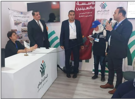
مؤتمر الـ cop/ جناح الهيئة