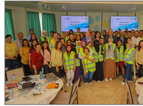
حملة تطوع الشباب

ولا سيما تنفيذ مبادرة ازرع والتي تأتي في إطار توجيهات فخامة السيد الرئيس عبد الفتاح السيسي، رئيس الجمهورية، بالتوسع في زراعة المحاصيل الإستراتيجية وخاصة محصول القمح، الذي يعتبر أحد أهم محاور الأمن الغذائي. وقد تم تنفيذ المبادرة تحت مظلة التحالف الوطني للعمل الأهلي والتنموي، وبالشراكة مع وزارة الزراعة. استهدفت المرحلة الأولى منها زراعة 150 ألف فدان قمح استفاد منها 100 ألف مزارع في (8) محافظات، كما تم إطلاق المرحلة الثانية من المبادرة والتي تستهدف زراعة مليون فدان قمح يستفيد منها 500 ألف مزارع في 14 محافظة. فضلاً عن ذلك استمرت المشاركة في مبادرة حياة كريمة، مبادرة نور حياة، مبادرة المواطنة، بالإضافة إلى المشاركة في برنامج فرصة للتمكين الاقتصادي، برنامج وعي للتنمية المجتمعية بالشراكة مع وزارة التضامن الاجتماعي.